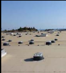
iluminação natural tipo solar tube