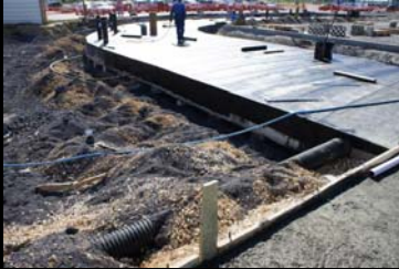
escórias como camadas de enchimento