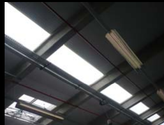
iluminação natural cobertura com chapa translúcida