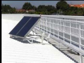
painéis solares para produção AQS