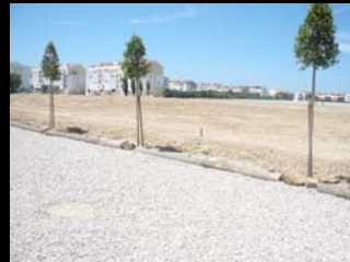
zona de exposição de produtos permeável baixo índice de implantação - estacionamento em cave