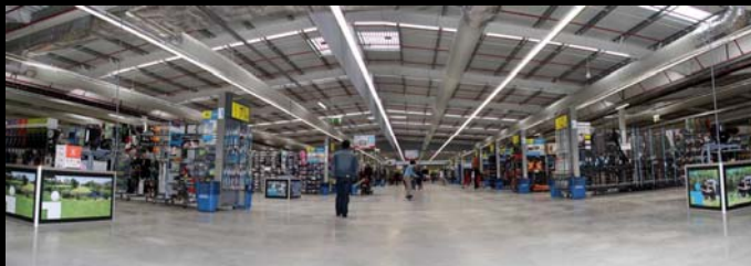
iluminação natural com cobertura parcialmente em chapas translúcidas