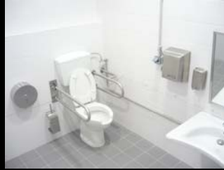
instalações sanitárias adaptadas a PMC