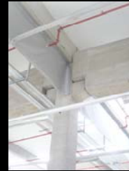
Estrutura de betão pré-fabricada em Portugal