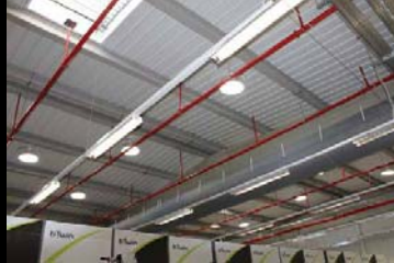
sensores luminosidade + regulação fluxo