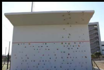
parede de escalada na fachada dos banheiros