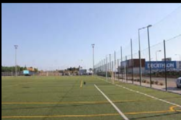
rega campo futebol desde depósito pluviais