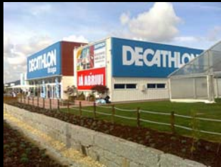
tratamento de linha de água