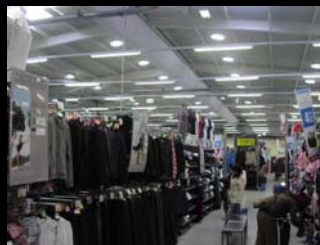
iluminação natural - tipo solartube