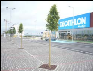
árvores de alinhamento - ensombramento e melhoria da qualidade do ar