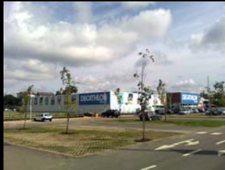
arborização de folha caduca