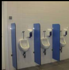
fluxómetros nos urinóis