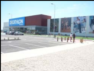
estacionamento para motociclos envidraçados de baixa condutividade