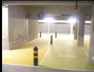
lugares de estacionamento para eléctricos