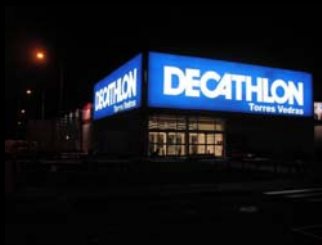
retroiluminação fluorescente - tipo T5