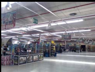
regulação de fluxo - iluminação artificial