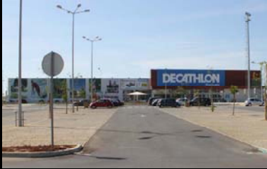
regulação fluxo iluminação artificial