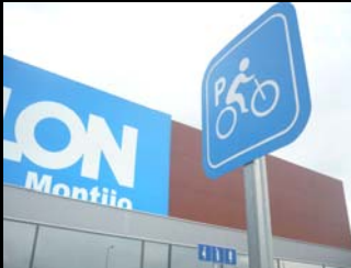
lugares de estacionamento de cortesia