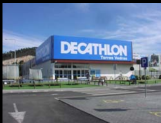
pala ensombramento envidraçados